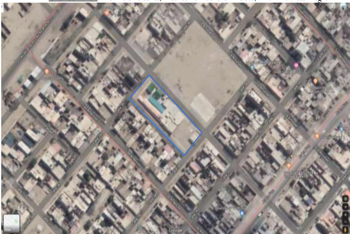
Grafico N° 01: Provincia de Santa, Distrito de Nuevo Chimbote, AA. HH. Vista Alegre

Región : Ancash Departamento : Ancash Provincia : Santa Distrito : Nuevo Chimbote