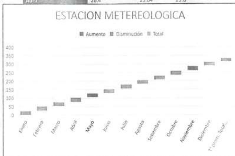
Variación Mensual de Temperatura