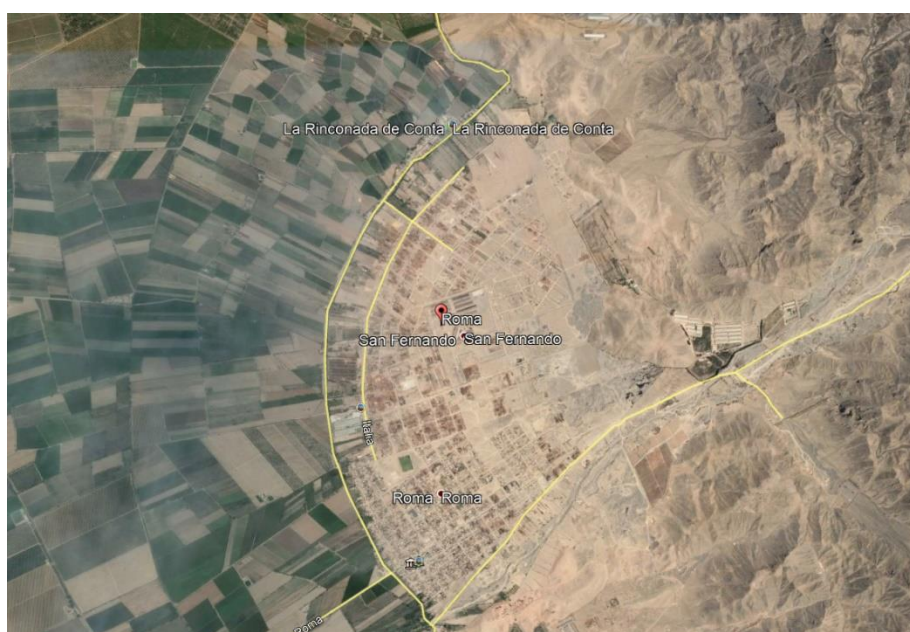
VISTA PANORAMICA DE LA ZONA DE INTERVENCION