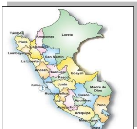
Mapa del Perú