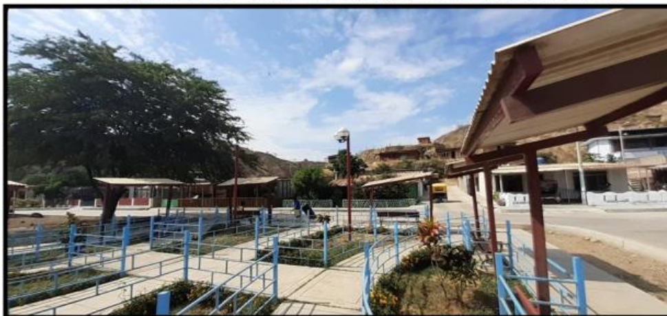
Imagen 01.- VISTA GENERAL DEL ESTADO ACTUAL DEL PARQUE TECNOLÓGICO

En los cuales se proponen una serie de acciones orientadas a mejorar la prestación de los servicios en la infraestructura de cada una de las intervenciones detalladas con anterioridad.