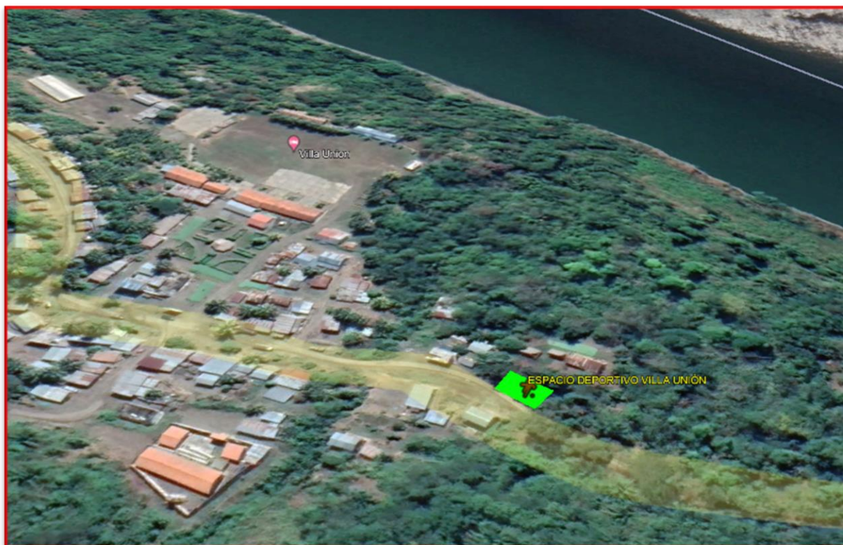
VISTA SATELITAL DEL PROYECTO EN MENCIÓN

En el Centro Poblado de Villa Unión del Distrito de Anchihuay, se encuentra ubicado geográfica y administrativamente dentro de la Provincia de La Mar, del Departamento y Región de AYACUCHO. El ámbito territorial está comprendido entre las latitudes de 700 a 4,600 m.s.n.m. el Centro Poblado de Villa Unión está a una altitud de 720.00 m.s.n.m. aproximadamente y la capital del Distrito tiene una altitud promedio de 755.00 m.s.n.m.