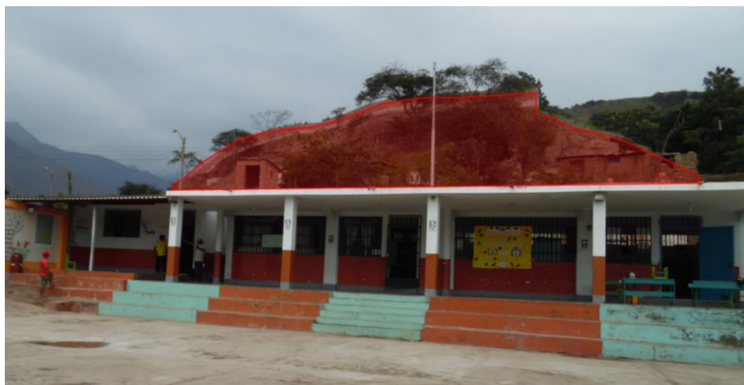
Foto N.º 1: Vista interior del colegio, donde se observa que el colegio, está a un nivel inferior del cerro.

Se identifica en la parte superior del colegio de color rojo el cerro, que representa un peligro por los deslizamientos.