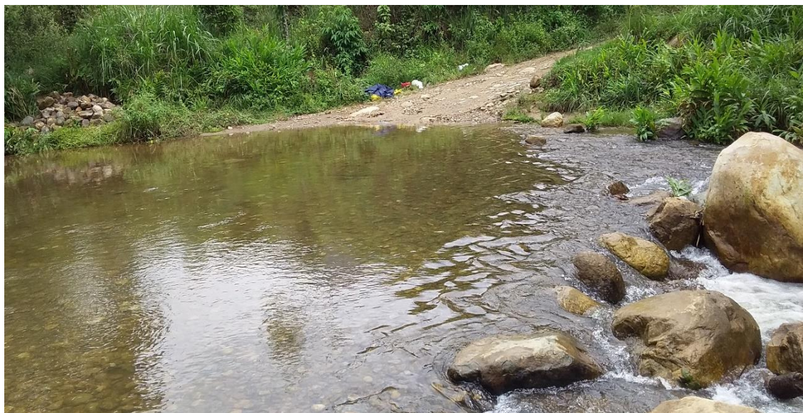
Imagen N° 03: Situación actual