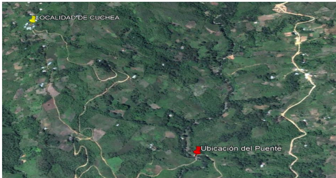
Imagen N° 02: Ubicación del punto donde se ejecutará el Puente

En el punto donde se ejecutará el puente no hay ninguna estructura existente, el cual está ubicado a 920 m desde la CARRETERA EMPALME PE 3N, con un tiempo aproximado de 5 min. El cual sirve de transitabilidad diaria para los pobladores de esa zona.