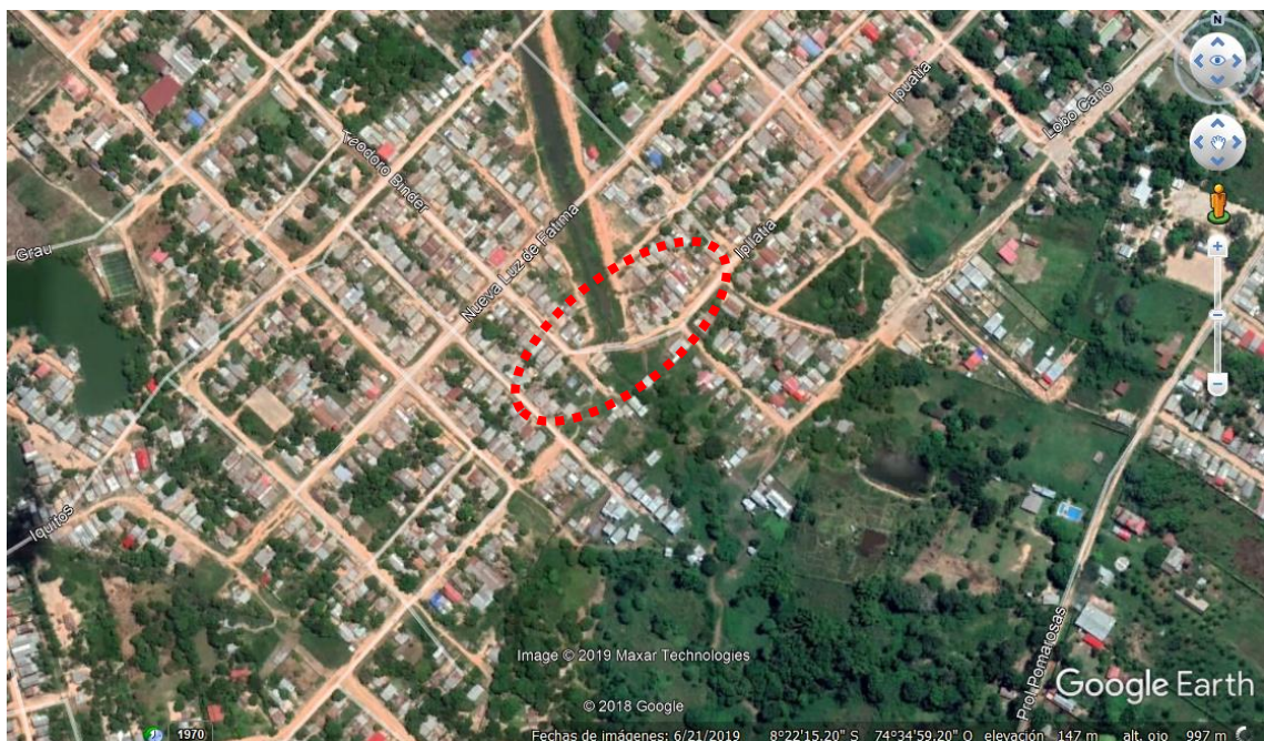
Vista N° 01: Vista Área del Puente proyectado.

ESTE: 545886.864 E NORTE: 9074685.537 N ALTITUD: 150.00 m.s.n.m.