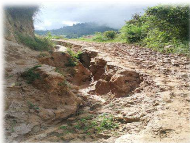
FOTO N° 1 y 2.- Se observa la carpeta de rodadura en estado de deterioro, por la falta de obras de arte, como son: cunetas, badenes y/o alcantarillas.