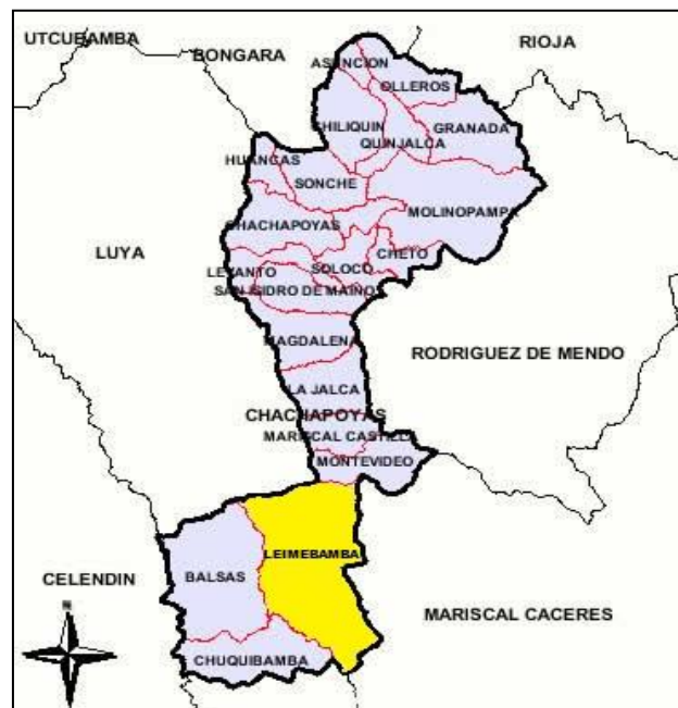
Lamina 04: MAPA DEL DISTRITO DE LEIMEBAMBA