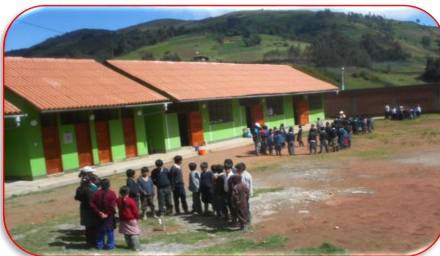
IMAGEN N° 05 Imagen de la Instituciones Educativas de Silva.

La Educación en el distrito de Acoria, es a nivel: Inicial, Primaria y Secundaria y cuenta un Instituto de Educación Superior Tecnológico. En los últimos años la educación ha mejorado notablemente.