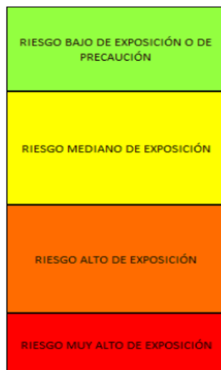
IMAGEN N° 03: Código de colores de evaluación de riesgo por exposición al COVID-19