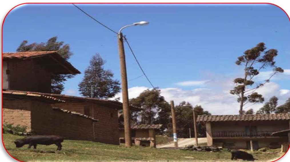
IMAGEN N° 07. Viviendas de Silva.

En cuanto a vivienda las casas en su mayoría son de construcción antigua y de material rústico (Adobe y Tapial), lo que es saneamiento está en proceso de construcción, agua, desagüe, letrinas a lo largo y ancho de la provincia. La mayoría de las viviendas se caracterizan principalmente por su precariedad y rusticidad tanto por el material utilizado como por la tecnología utilizada en la construcción.