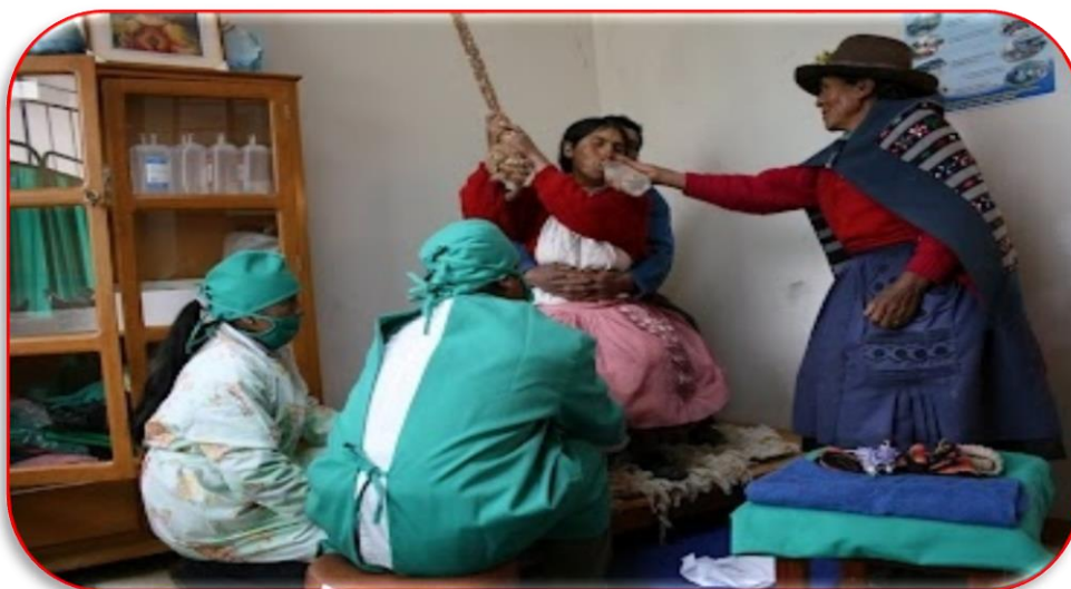
IMAGEN N° 06. Personal de la salud en el Centro de salud de Silva.