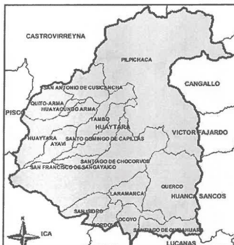
Ilustración N.º 03 Accesos al Ubicación del ámbito de intervención