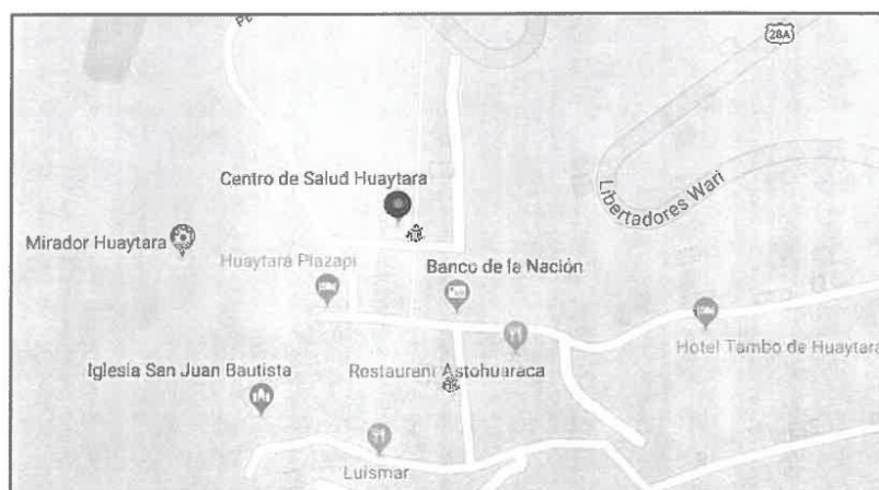
Ilustración N° 04 Establecimiento de Huaytara