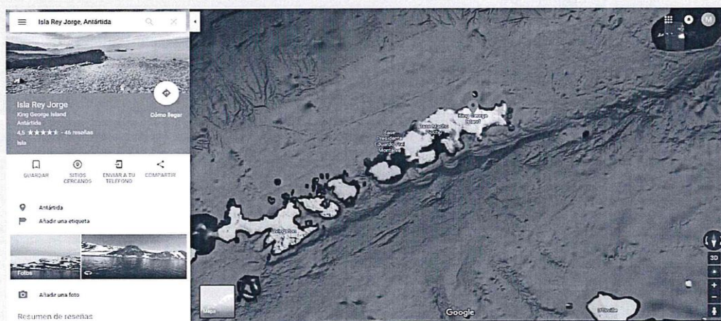
Isla Rey Jorge en la Antártida.

La Antártida es el cuarto continente más extenso del mundo, ubicado en la zona más austral de la Tierra; abarca los territorios al sur del paralelo 60° S, tiene una forma casi circular, de la que sobresale la península Antártica en dirección sur-norte.