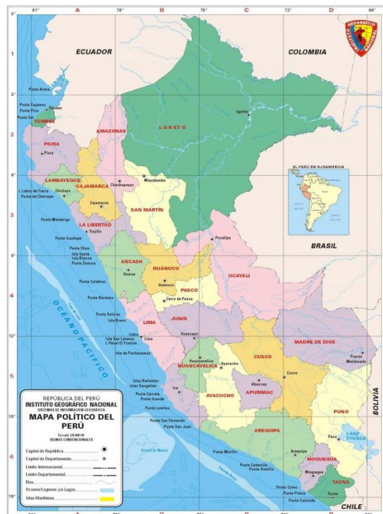
MAPA DEL PERU POR DEPARTAMENTO.