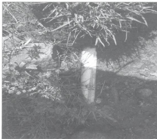
Imagen N° 02: tuberías de línea de conducción

MEJORAMIENTO Y AMPLIACIÓN DEL SERVICIO DE AGUA POTABLE EN LOS BARRIOS DE TARACHA Y QINWACHA DEL CENTRO POBLADO DE MANZANAYOCC DEL DISTRITO DE SOCOS, PROVINCIA DE HUAMANGA, DEPARTAMENTO DE AYACUCHO", CON CUI N° 2447130