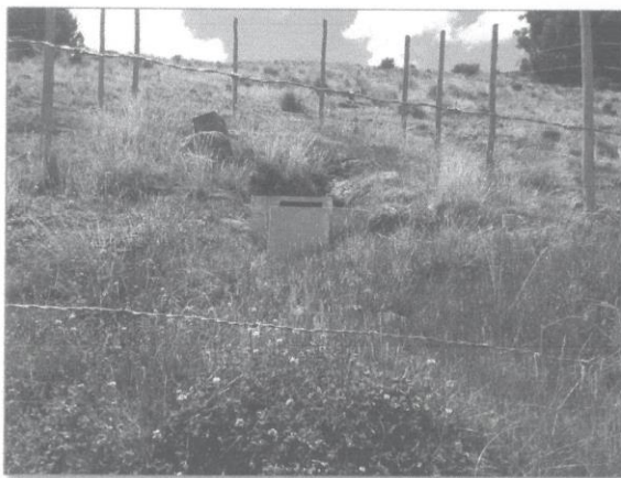
Imagen N° 01: Captación manantial

Se tiene 3 captaciones existentes y están ubicadas en el mismo manante, son de tipo ladera, no es necesario la construcción de una nueva captación, las estructuras de captación se encuentran en condiciones adecuadas y abastecen con suficiencia al reservorio existente, y cuenta con una antigüedad aproximada de 2 años, construidas por la misma municipalidad de Socos entre los años 2015-2017.