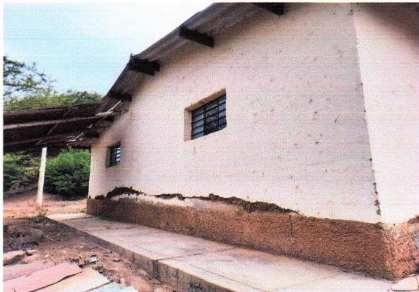
Foto 02. Fachada exterior en mal estado