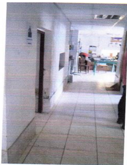
Foto 05. Pintura interior en mal estado

REGION LA LIBERTAD DIRECCION REGIONAL DE SALUD COORD. EMERGENCIAS Y DESASTRES U. DE SALUD GRAN CHIMU