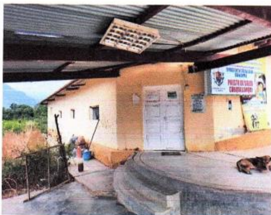
Foto 01. Frontis del Puesto de Salud

REGION LA LIBERTAD GERENCIA REGIONAL DE SALUD COORD. EMERGENCIAS Y DESASTRES U.E. DE SALUD GRAN CHIMU