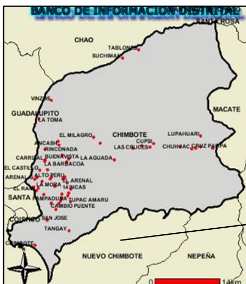
PROV. DEL SANTA