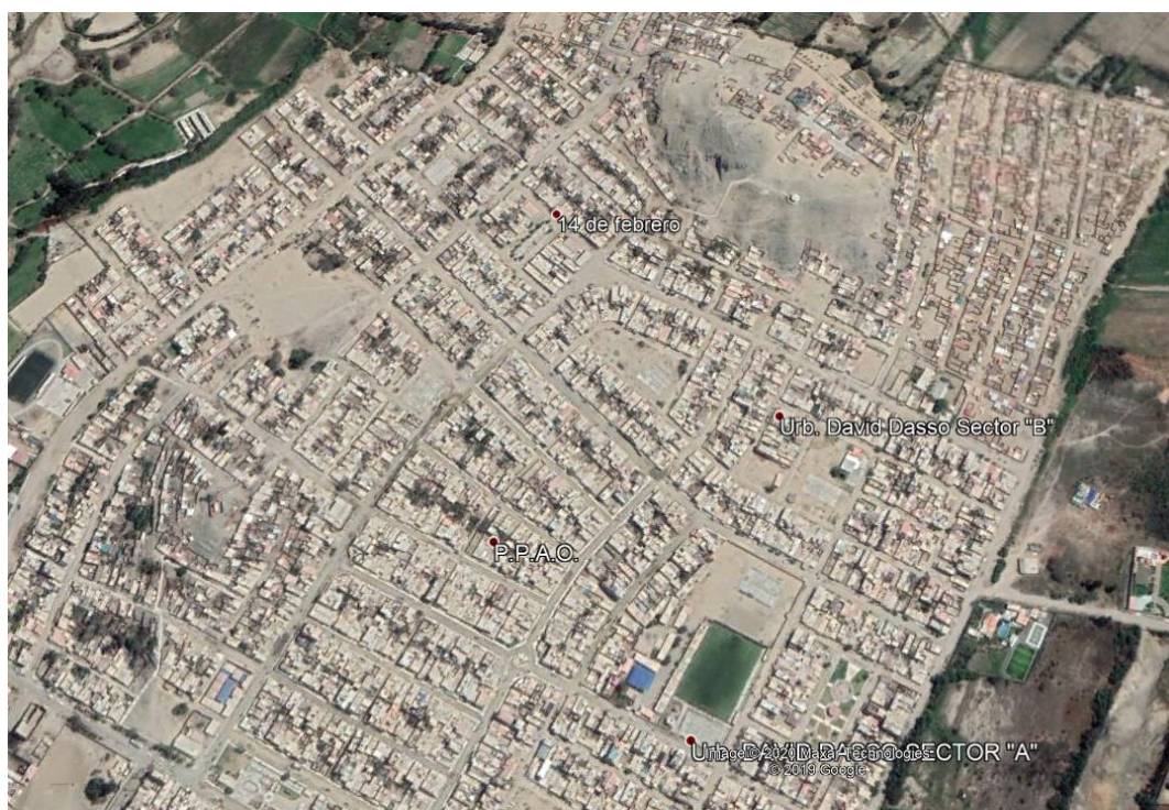
Micro Localización (Distrito Nuevo Chimbote – 14 de Febrero)