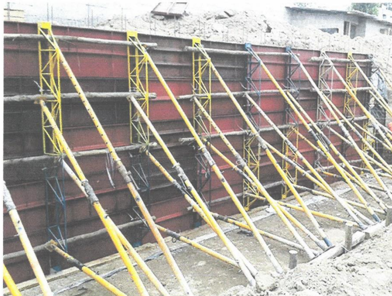
ENCOFRADO LINEAL (IMÁGENES REFERENCIALES)