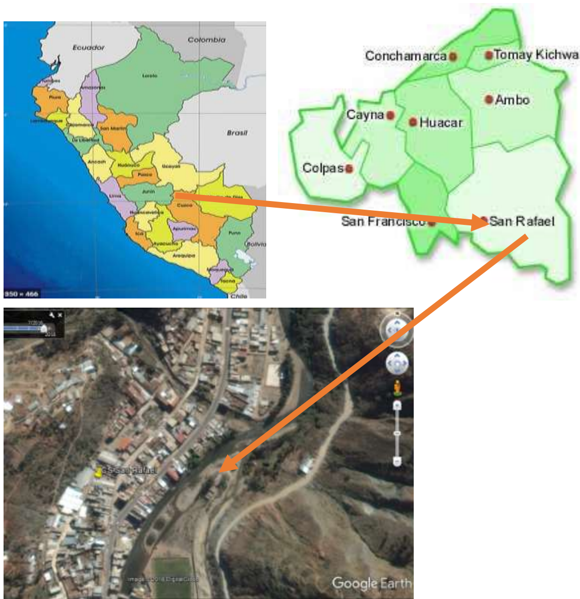
FIGURA N°01: UBICACIÓN CARTOGRAFICA

El terreno del establecimiento cuenta con un área total de 3,013.24 m 2 cuya área se detalla a continuación.