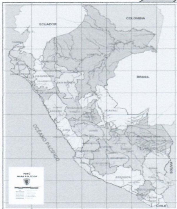
GRAFICO N° 01: MAPA POLITICO DEL PERU