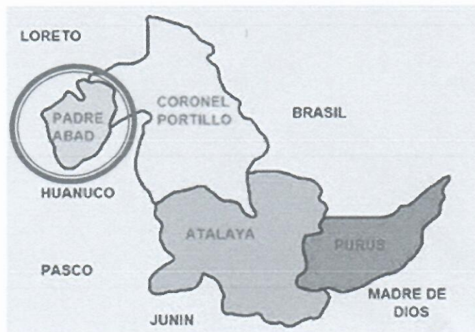
GRAFICO N° 02: MAPA REGION UCAYALI