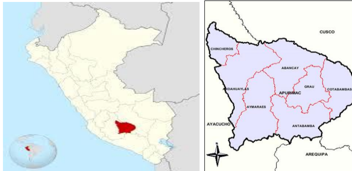
Mapa N° 1: Macro localización