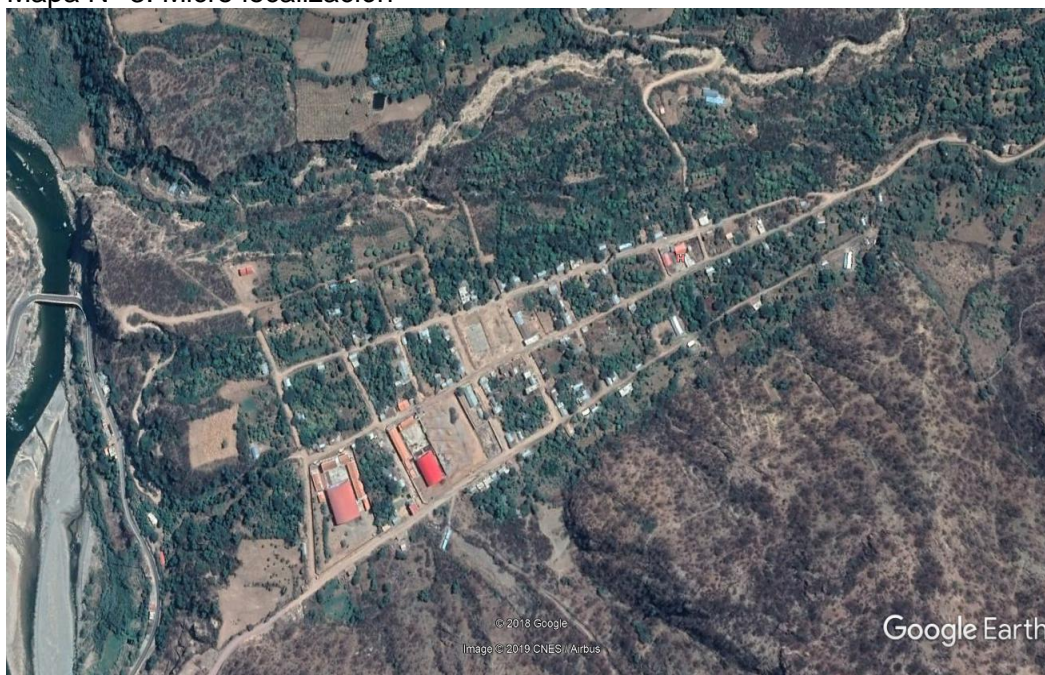
Mapa N° 3: Micro localización