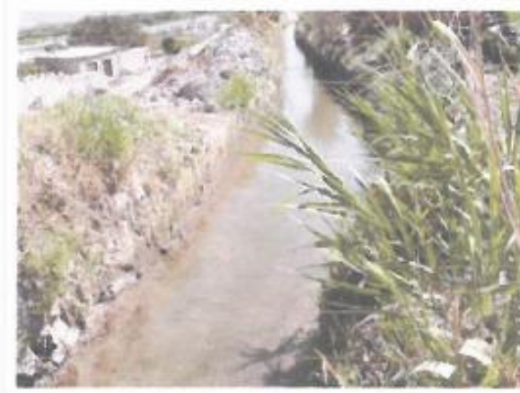
Se observa en la fotografía el punto de captación para el tratamiento del agua para el C.P. Yauce

El centro poblado de Yauce NO cuenta con sistema de saneamiento básico. El consumo de agua, actualmente para la población es captada del canal la Barreda mediante baldes y estas mismas son depositas en cilindros o tanques rotoplas dicha agua no tiene tratamiento alguno a la fecha.