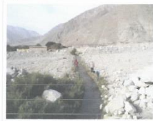
Lond de Heggado del L.P. Youce