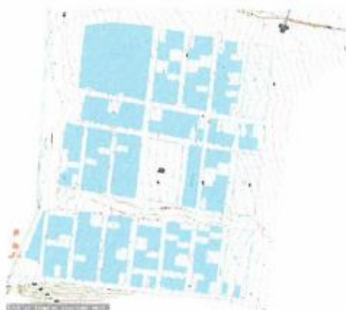
Plano de Distribución de Lotes HABITADOS (249)