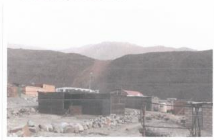
En la fotografía se observa el tanque rotoplas donde un poblador de yauce almacena su agua extraída del canal de la Barreda-Yauce