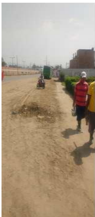
Imagen 10, Imagen 11 e Imagen 12: Buzones de alcantarillado en Urb. Micaela Bastidas.

Calle y buzón de la Urb. Miguel Grau, se verifica que represamiento de aguas residuales