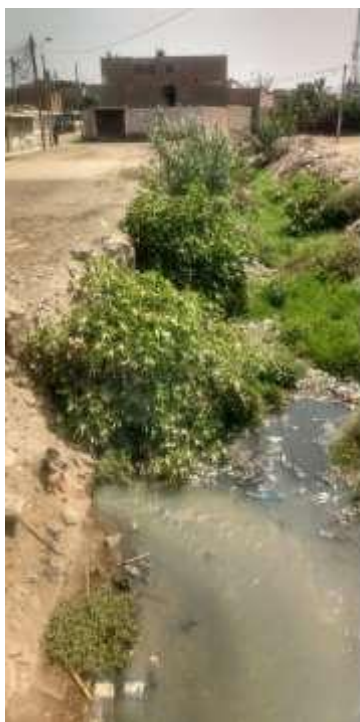
Imagen 13 e Imagen 14: Descargas de la ciudad de Paramonga.

Calle y buzón de la Urb. Micaela Bastidas, se verifica que represamiento de aguas residuales