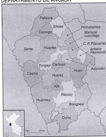
GRÁFICA 01: LOCALIZACIÓN DEPARTAMENTO DE ANCASH