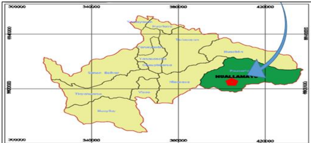
Mapa N° 03.- Ubicación y Localización del centro poblado de Huallamayo.